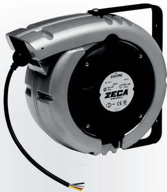
Z4016 CARRETEL AUTOMÁTICO BLINDADO