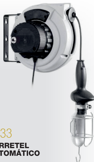
3033 CARRETEL AUTOMÁTICO

Peso: 2,5 kg · Medidas: (A) 275 mm x (L) 325 mm