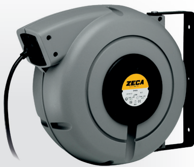
Z4006 CARRETEL AUTOMÁTICO BLINDADO

Peso: 3,5 kg · Medidas: (A) 290 mm x (L) 310 mm