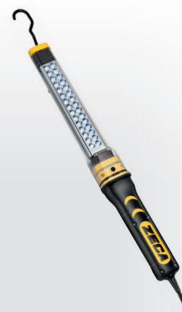
Z4019 LANTERNA COM LED