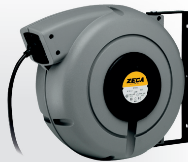
Z4007 CARRETEL AUTOMÁTICO BLINDADO

Peso: 8 kg · Medidas: (A) 272 mm x (L) 470 mm