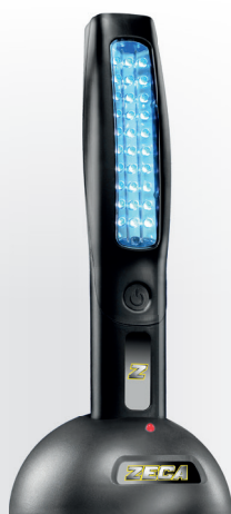
Z4017 LANTERNA COM LED