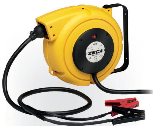
Z4010 CARRETEL AUTOMÁTICO BLINDADO

Peso: 8,5 kg · Medidas: (A) 272 mm x (L) 470 mm