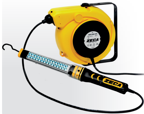
Z4023 CARRETEL AUTOMÁTICO BLINDADO

Peso: 11,5 kg · Medidas: (A) 360 mm x (L) 400 mm