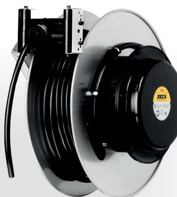
Z4004 CARRETEL AUTOMÁTICO

Peso: 35 kg · Medidas: (A) 500 mm x (L) 610 mm