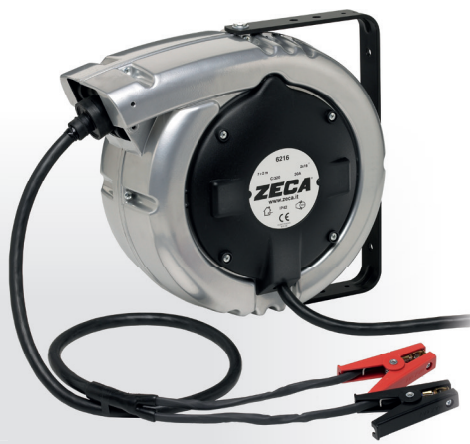
Z4011 CARRETEL AUTOMÁTICO BLINDADO

Peso: 4,5 kg · Medidas: (A) 190 mm x (L) 350 mm