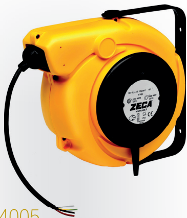
Z4005 CARRETEL AUTOMÁTICO BLINDADO