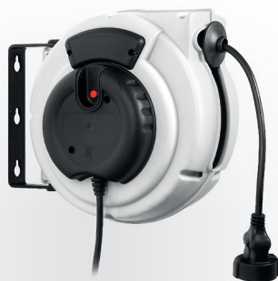
3032 CARRETEL AUTOMÁTICO