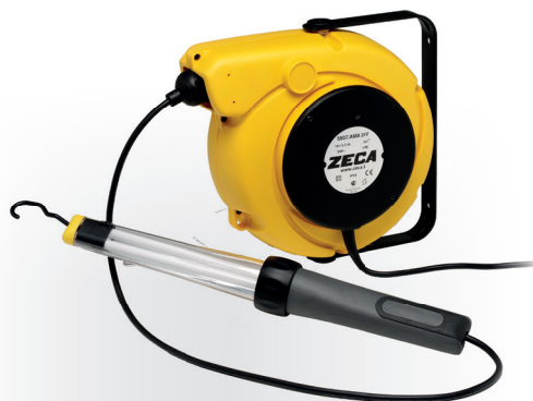
Z4025 CARRETEL AUTOMÁTICO BLINDADO

Peso: 4,5 kg · Medidas: (A) 310 mm x (L) 390 mm