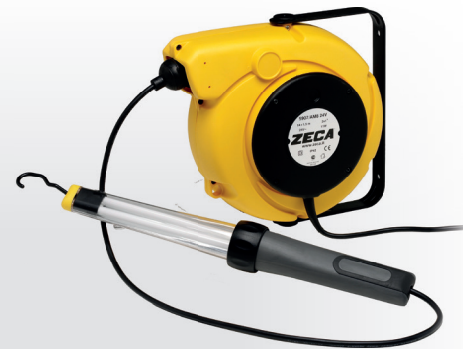
Z4024 CARRETEL AUTOMÁTICO BLINDADO

Peso: 4,5 kg · Medidas: (A) 310 mm x (L) 390 mm