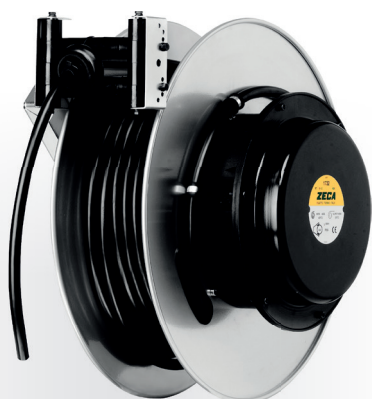
Z4002 CARRETEL AUTOMÁTICO

Peso: 40 kg · Medidas: (A) 500 mm x (L) 610 mm