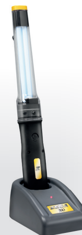
Z4018 LANTERNA COM LÂMPADA FLUORESCENTE