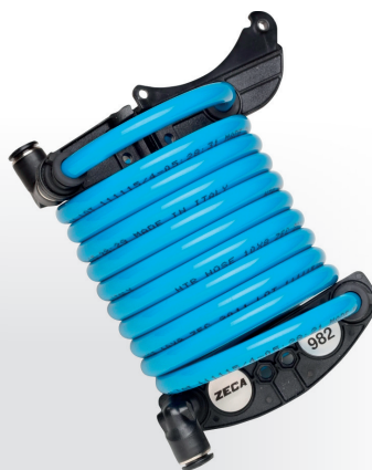
Z4050 MANGUEIRA ESPIRAL PARA BALANCIN

Peso: 12 kg · Medidas: (A) 360 mm x (L) 400 mm