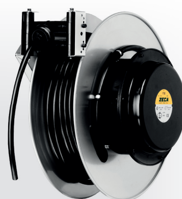
Z4001 CARRETEL AUTOMÁTICO

Peso: 2,5 kg · Medidas: (A) 275 mm x (L) 325 mm