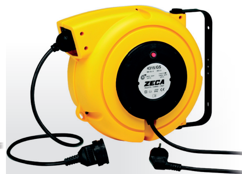
Z4015 CARRETEL AUTOMÁTICO BLINDADO

Peso: 11,5 kg · Medidas: (A) 360 mm x (L) 400 mm