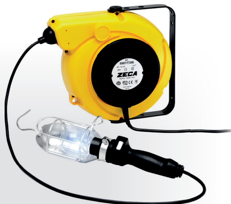
Z4026 CARRETEL AUTOMÁTICO BLINDADO

Peso: 4,5 kg · Medidas: (A) 290 mm x (L) 310 mm