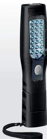
Z4040 LANTERNA COM LED

Peso: 1,1 kg · Medidas: (A) 330 mm x (L) 57 mm